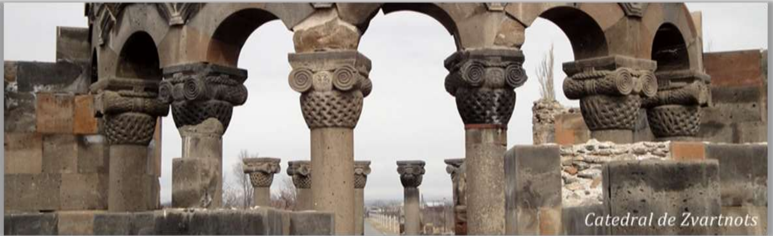
Catedral de Zvartnots